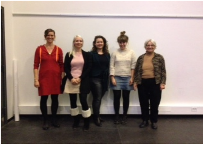
Oplægsholderne og arrangøren