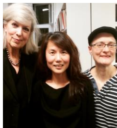
Strukturaften: Kærlighedens politikker