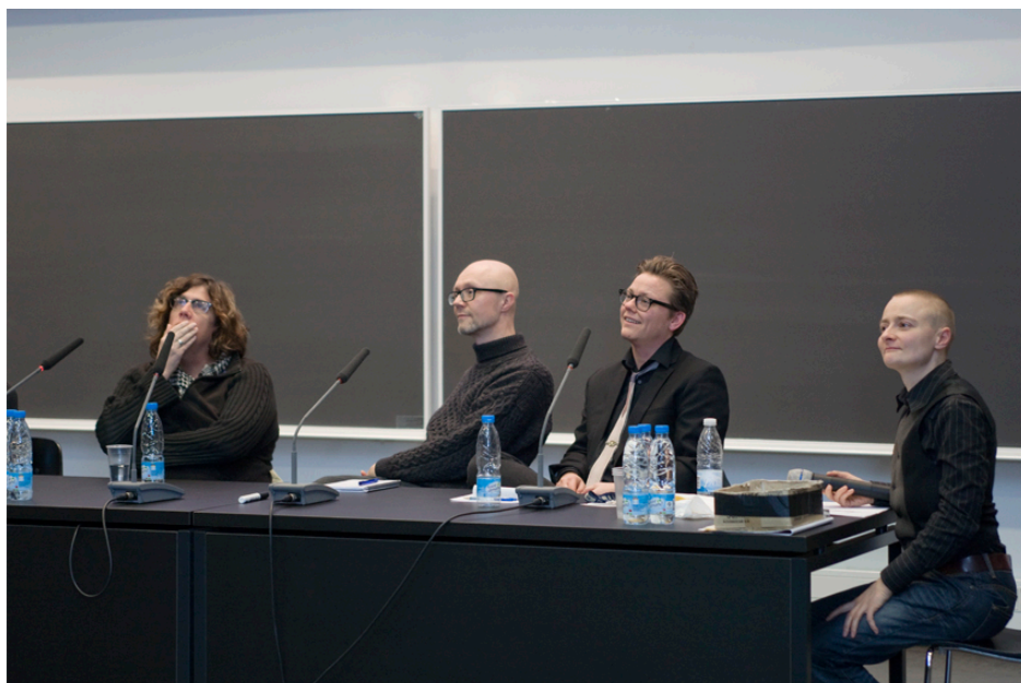
Det velbesøgte trans*-seminar blev afsluttet med en paneldebat mellem oplægsholderne.